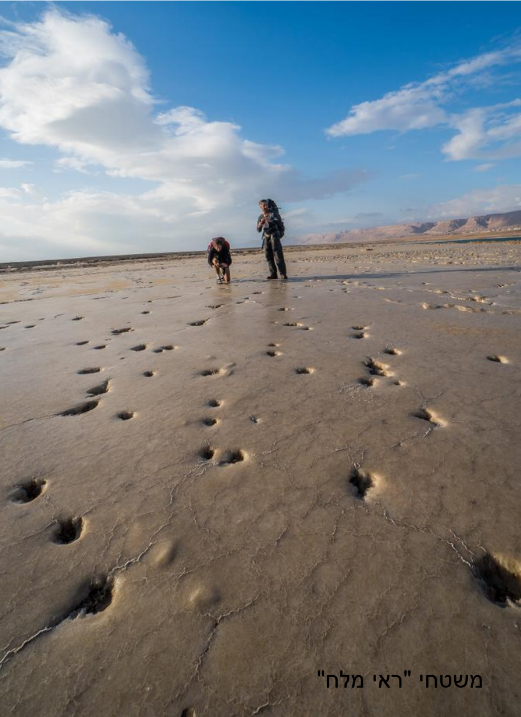
משטחי "ראי מלח"