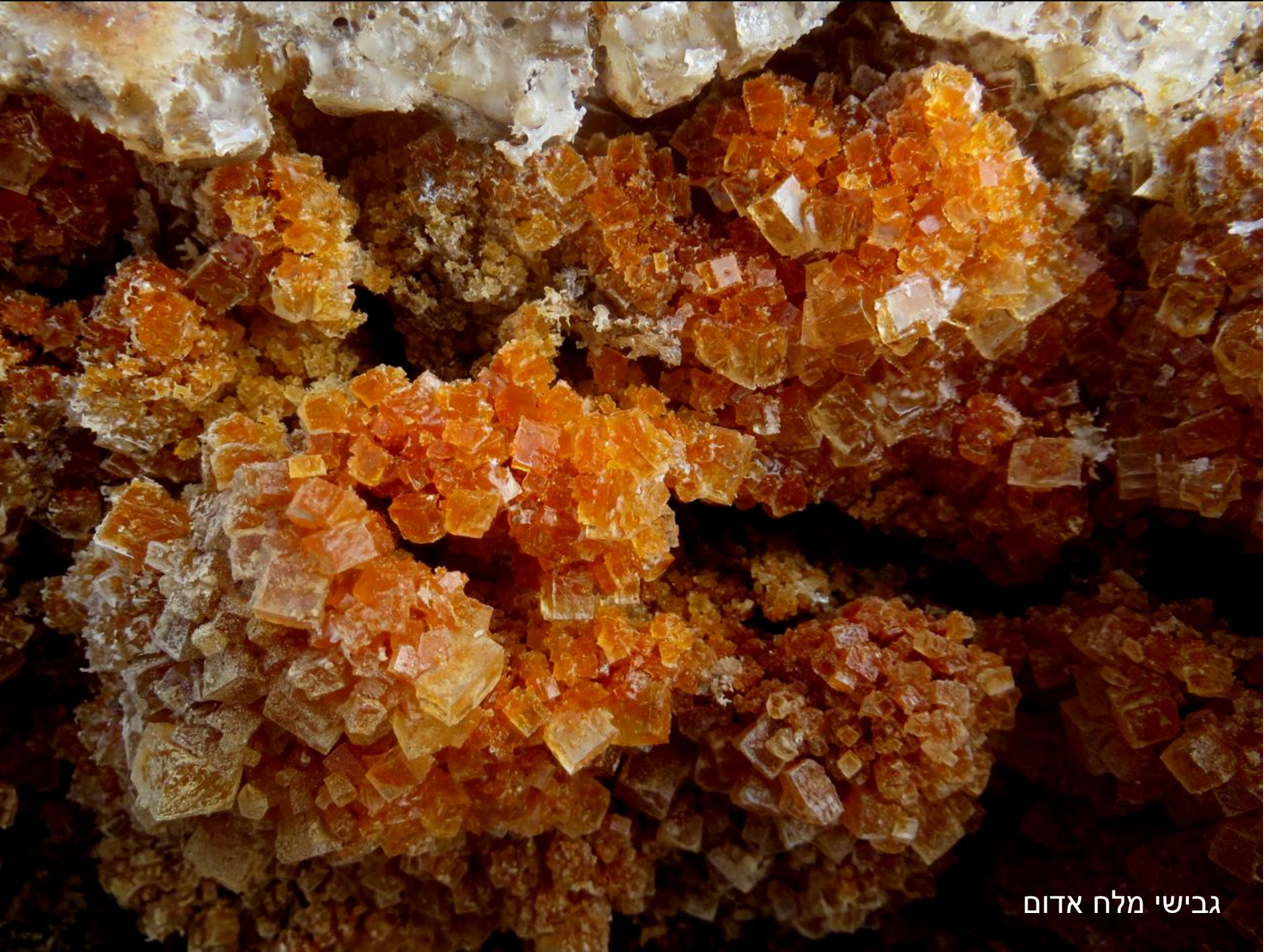
גבישי מלח אדום